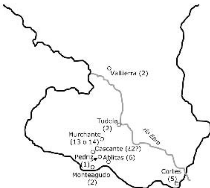
MAPA 1. Presencia de moriscos en Navarra según el informe del licenciado Pedro Lope de Lugo (1570)

de la presencia de población morisca y su comportamiento. El primer dato es incuestionable: la presencia de comunidades de moriscos en Navarra era mínima (Mapa 1), en torno a una treintena de vecinos identificados repartidos entre ocho localidades –Tudela, Monteagudo, Murchante, Pédriz, Cortes, Cascante, Valtierra y Ablitas. Algunos, como los de Tudela, Murchante o Pédriz no levantaban sospechas y era considerados «buenos cristianos».